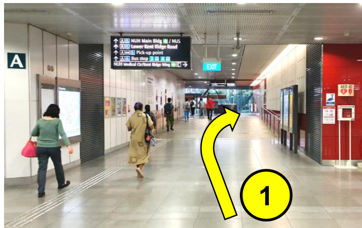
在环线肯特岗地铁站下车，从A出口出来后右转