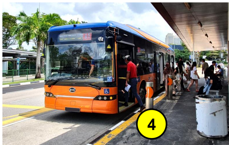
乘坐免费的新加坡国立大学校内巴士，车号为 A1 / D2 / K / BTC