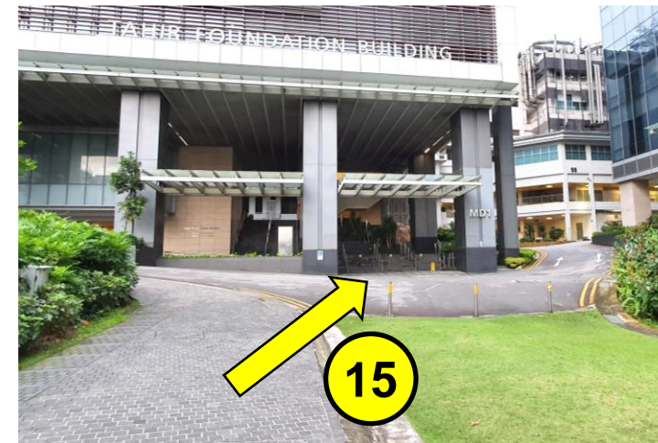
走过马路，到达 MD1 Tahir Foundation Building 大厅 。