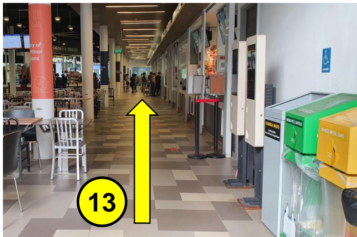
穿过 食堂 ，走向食堂的另一端。