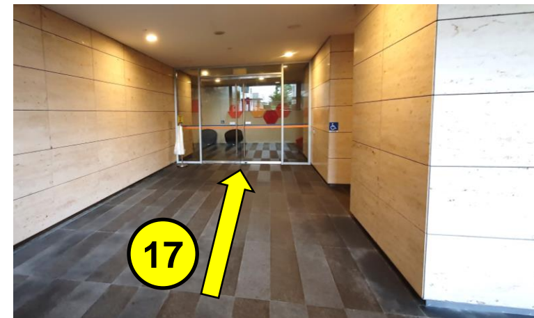
进入电梯厅，乘坐电梯前往 11 楼。 轮椅/PMA 使用者如果无法打开这扇门， 请拨打8030 5724。