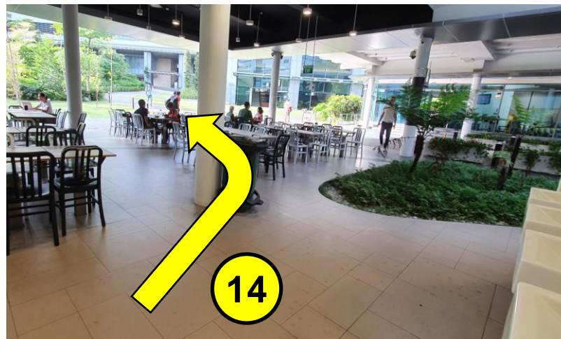
到食堂的另一端时 左转 ，前往 Tahir Foundation Building.