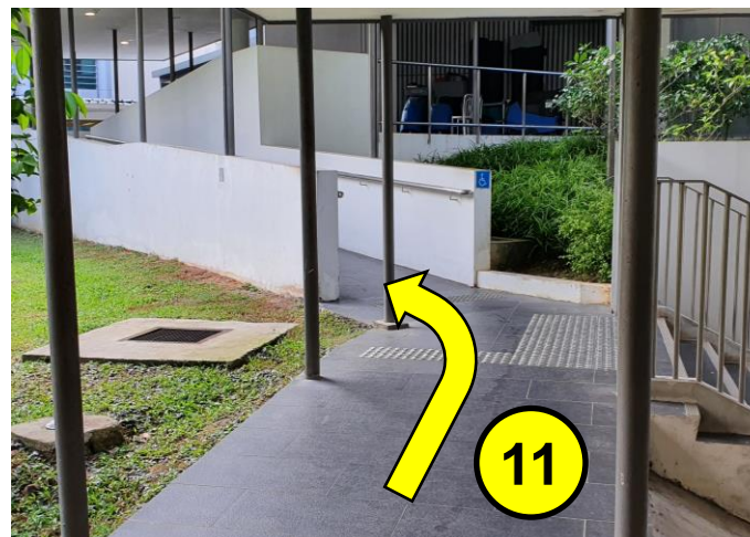
沿着斜坡继续前行。