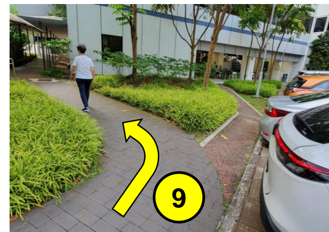
在这个路口左转，朝有盖走道方向前进。