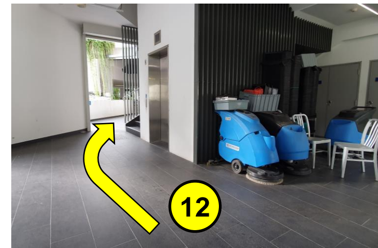
到达斜坡顶端，从这个通往食堂的门口出去。