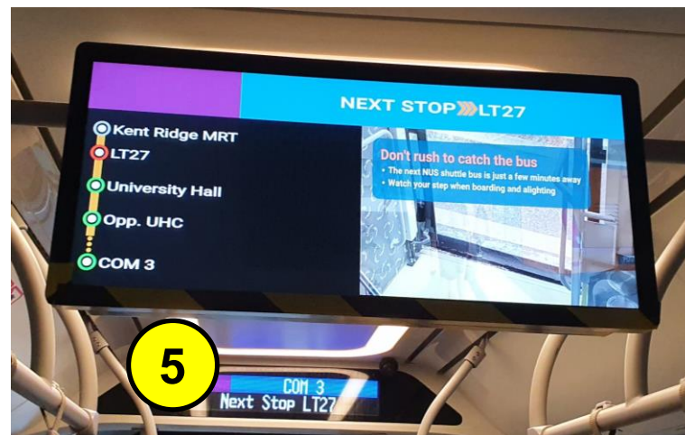
在下一站 LT27下车（巴士站编号：18301）。