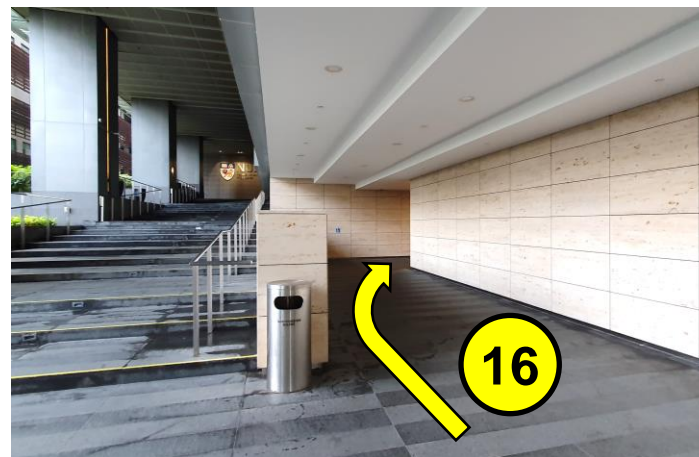
继续向前走， 靠右 转入 1 层电梯厅。