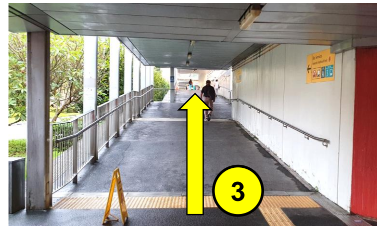
沿着有盖走道，朝3号巴士站方向行走（巴士站编号：18331）。