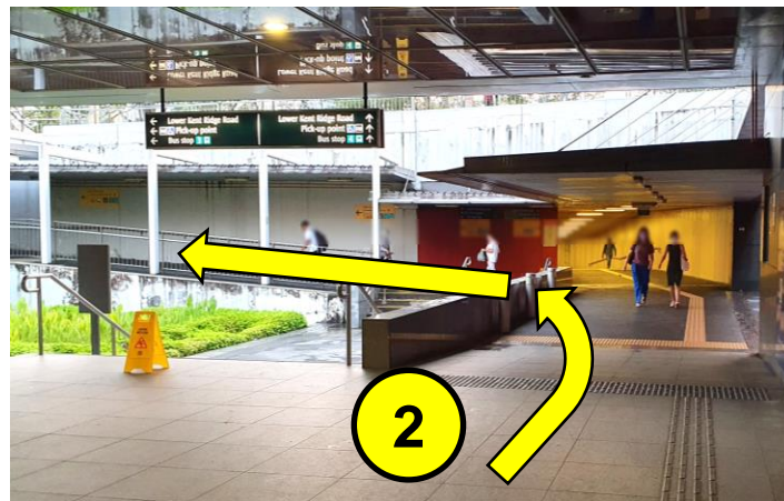
直行，在地下通道入口处左转