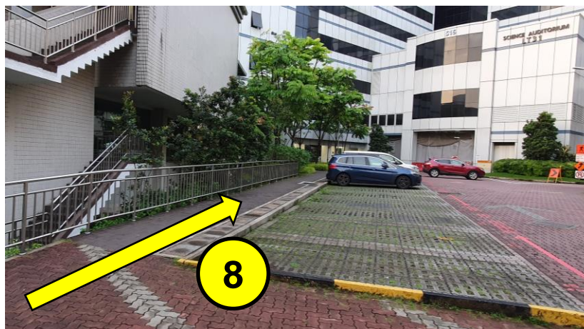
继续沿着人行道前行，经过停车场。