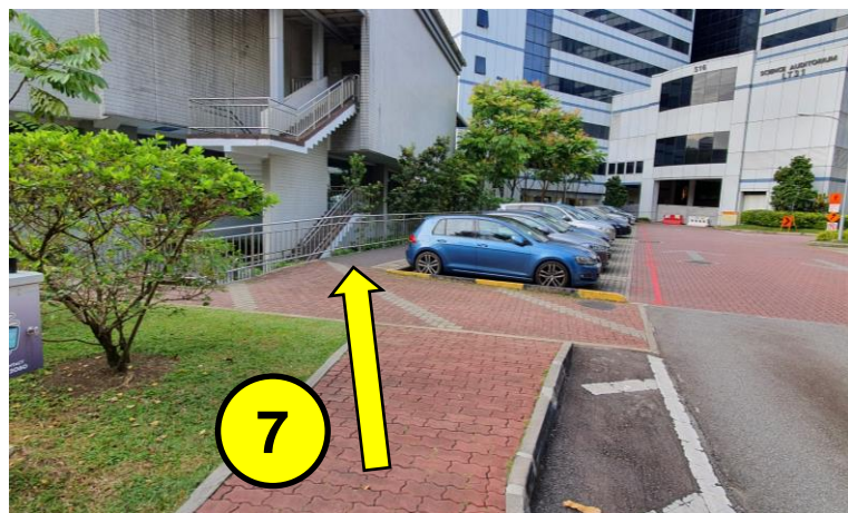
继续沿着人行道前行。