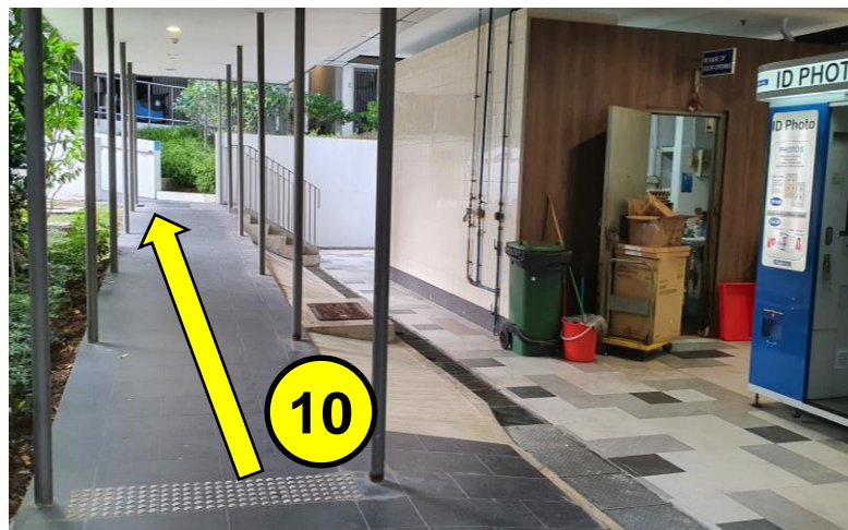
继续沿着有盖走道，向坡道方向前进。